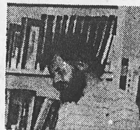
door Wim Rutgers

Naast de volledige naam komen we ook de initialen K.A.E. tegen, waarvan ik hier maar aanneem dat daarmee ook Erkelens aange-